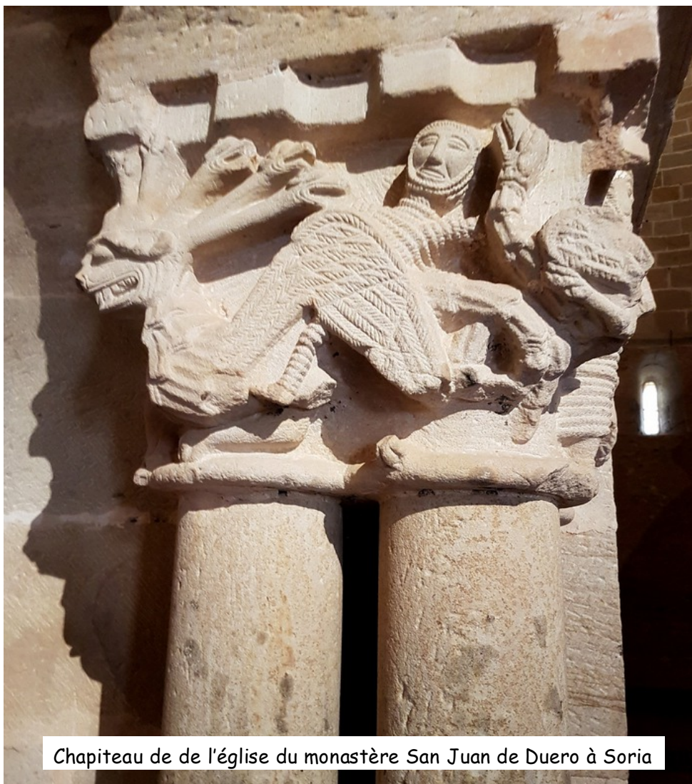
Chapiteau de de l'église du monastère San Juan de Duero à Soria